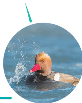
赤嘴潜鸭

为织牢织密生物多样性保护网,我省已将64%的高原重要湿地生态系统、30.7%的森林纳入自然保护区管理。丰富的森林资源、湿地资源,以及自然保护区的良好管理,为众多鸟类提供了安全、舒适的栖息环境。