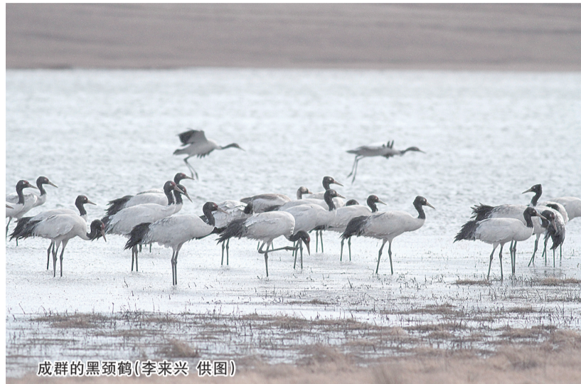
成群的黑颈鹤