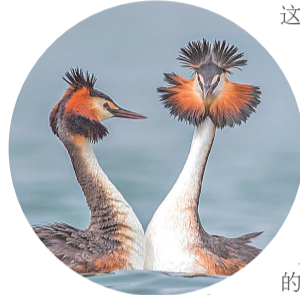
凤头鸊鷉