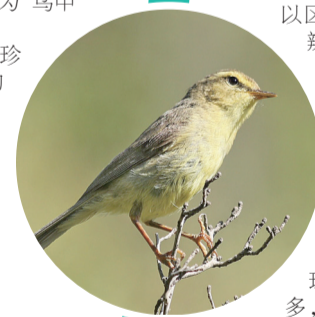
黄腹柳莺