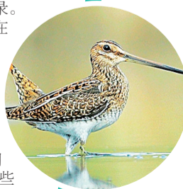
扇尾沙锥